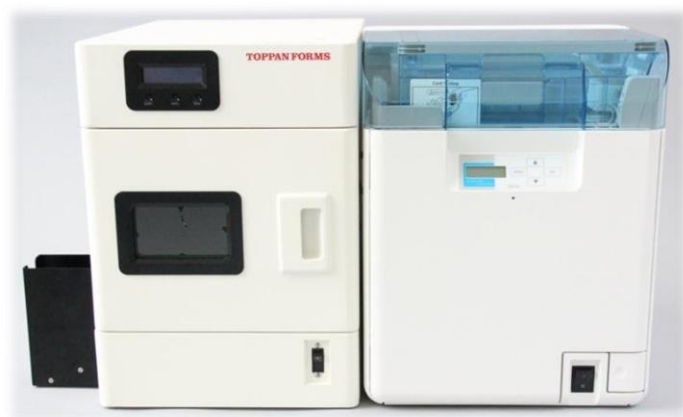
レーザー方式ユニット リボン方式ユニット

今後 ID カードは改ざん・偽造防止の観点からより高いセキュリティレベルを求める声が強まることが予想されます。トッパンフォームズではこうしたニーズに応える最適なカードと ID カード発行システムを拡販していきます。