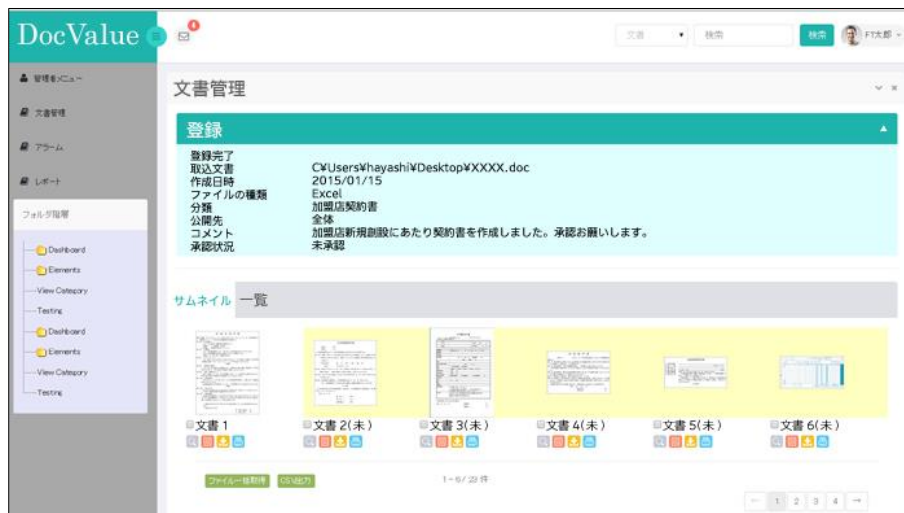
DocValue のご利用画面（予定）

大量の文書情報の電子化は、トッパンフォームズがスキャンやデータ入力などのビジネスプロセスアウトソーシング（BPO）サービスとして一括で請け負います。BPOはお客様の要望に合わせて、お客様の拠点に人員を派遣して行うオンサイト BPO、もしくは当社センターでの処理を行うことで、お客様が従来自社で行っていた事務処理を削減します。