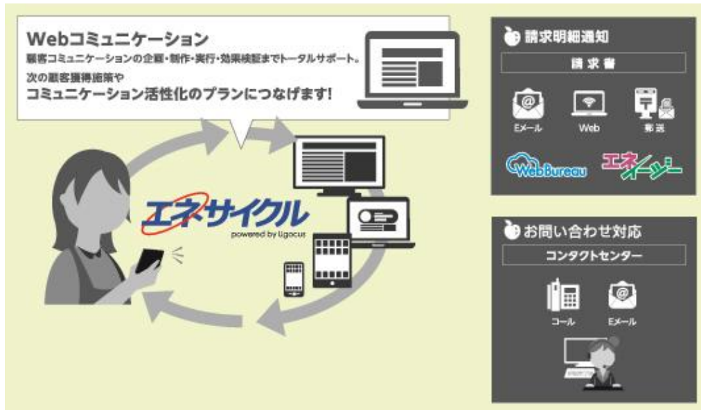
エネサイクルのサービスイメージ

「エネサイクル」は、Web コミュニケーションを中心とする顧客への情報発信や請求明細通知、コンタクトセンターによるリアルなコミュニケーションにより、顧客の声をエネルギー事業者様が提供するサービスに役立てることが可能となる顧客維持施策をパッケージ化したものです。