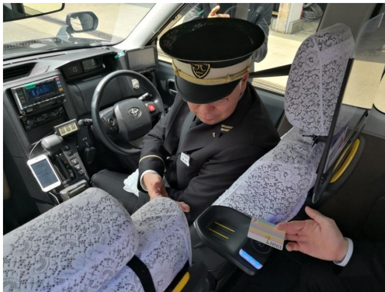
北星交通車両内の様子。クレジットカードに加え、複数ブランドでの電子マネー決済が可能に。

現在、北星交通ではSuica等交通系電子マネー、iD、nanacoが利用可能で、2018年内を目処にWAON、QUICPay+も利用可能になる予定です。